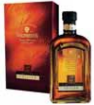
Wilthener Edition Weinbrand